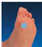
Fig. 2 Disfunctie / Rezultat anormal

Daca suprafata de reactie ramana albastra, neschimbata, exista tulburari ale functiei de protejare a pielii. Pielea este (prea) uscata, nu este elastica si nu