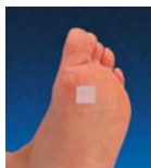
Fig. 1 Rezultat normal

Daca suprafata de reactie s-a colorat in totalitate in culoarea roz, starea si functia de aparare si protectie a pielii sunt intacte.