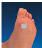
Fig. 3 Disfunctie / Rezultat anormal

Daca sunt doar suprafete mici ale compresei (zona de reactie) colorate in roz, restul suprafetei ramanand albastra, gradul de solicitare a pielii talpii